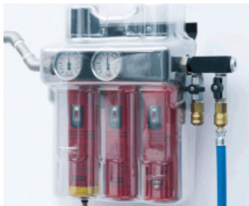
图4 油水分离器的透明保护罩